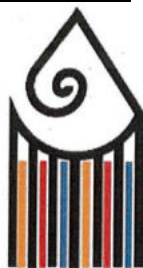
Liceo Artistico Musicale F. Palma Massa