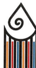
IPIAM P. Tacca Carrara