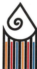
Liceo Artistico A. Gentileschi Carrara