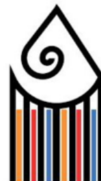
IPIAM P. Tacca Carrara

ISTITUTO DI ISTRUZIONE SUPERIORE ARTEMISIA GENTILESCHI SEDE PALMA