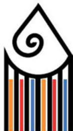
Liceo Artistico A. Gentileschi Carrara