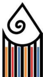
Liceo Artistico A. Gentileschi Carrara